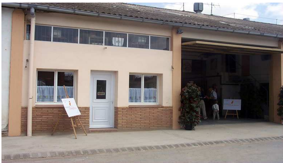
SEU SOCIAL DE FUNDACIÓ VOLEM FEINA

Aquest servei no podria ser realitzat sense l'ajuda de voluntaris i de totes les persones del nostre entorn que creuen en el nostre treball i, solidàriament, ens guarden tot allò que ja no utilitzen, pensant en el servei que pot fer a altres persones.